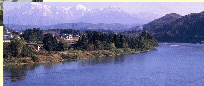
病室からの風景 魚沼三山と長江信濃川