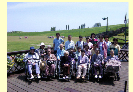
施設外レクリエーションの様子