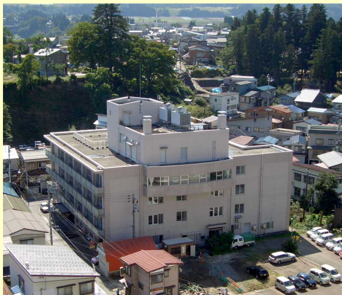
介護老人保健施設「水仙の家」

専門知識を基に安全なサービス提供を行い、ご利用者・家族との信頼関係の強化と地域に密着した老健施設としての役割を果たす。