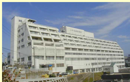
小千谷総合病院全景

一般病棟入院基本料 10対1 入院基本料 障害者施設等入院基本料 13対1 入院基本料